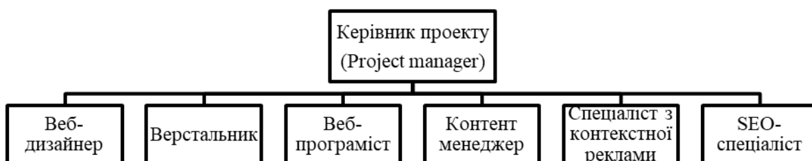
Рис. 1. Структура проекту

Зобразимо схематично структуру проекту (рис.1).