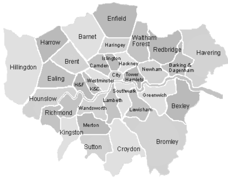
Карта районів Лондону

Наприклад, жителі району ТауерХемлетс в Лондоні скаржаться на засилля іммігрантів з Близького Сходу, яким практично «належить» цей квартал. На даний час в кварталі побудовано близько 20 мечетей і планується спорудження іще кількох. Непоодинокими є випадки нападу іммігрантів на англійців, що не поділяють їх поглядів, а тому в місцеві магазини та інші заклади корінні англійці намагаються не ходити. У мережі Інтернет можна знайти чимало відео-роликів, що демонструють мігрантів, що нав'язують корінним жителям релігійні дискусії і в разі несприйняття їх позиції починають образи, приниження, а потім розв'язують бійку серед білого дня на вулиці, на очах у перехожих. Крім того, навколо бійки одразу починають збиратися інші мігранти, готові підтримати своїх побратимів по вірі і побити невинних англійців. Отже, в Лондоні гості поведуться як господарі.