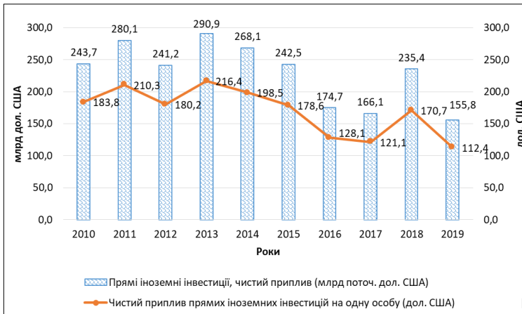
Рис. 1. Динаміка чистого припливу прямих іноземних інвестицій в економіку Китаю

інвестиційній привабливості економіки країни, про що свідчить аналіз її головних індикаторів [7, с. 84–87] – чистого припливу прямих іноземних інвестицій як в цілому, так і в розрахунку на одну особу (рис. 1).