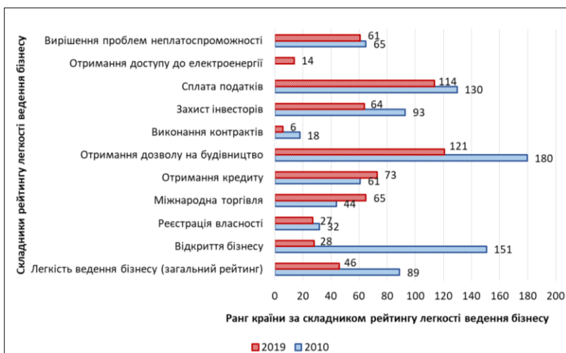
Рис. 3. Ранги Китаю за складниками рейтингу легкості ведення бізнесу в 2010 та 2019 рр.