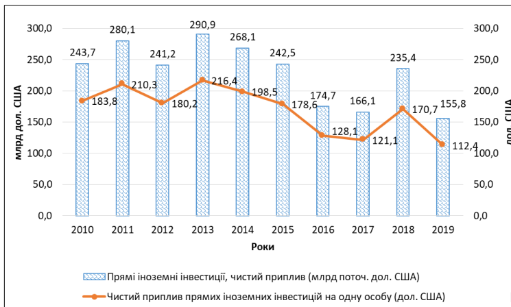
Рис. 1. Динаміка чистого припливу прямих іноземних інвестицій в економіку Китаю

інвестиційній привабливості економіки країни, про що свідчить аналіз її головних індикаторів [7, с. 84–87] – чистого припливу прямих іноземних інвестицій як в цілому, так і в розрахунку на одну особу (рис. 1).