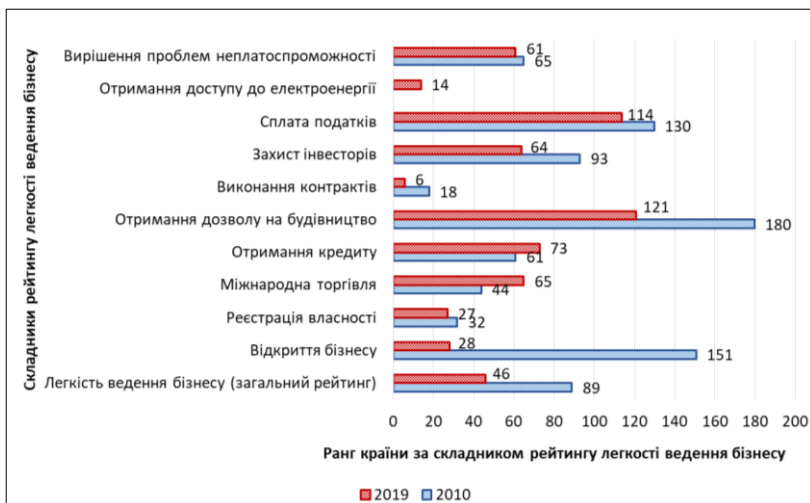
Рис. 3. Ранги Китаю за складниками рейтингу легкості ведення бізнесу в 2010 та 2019 рр.