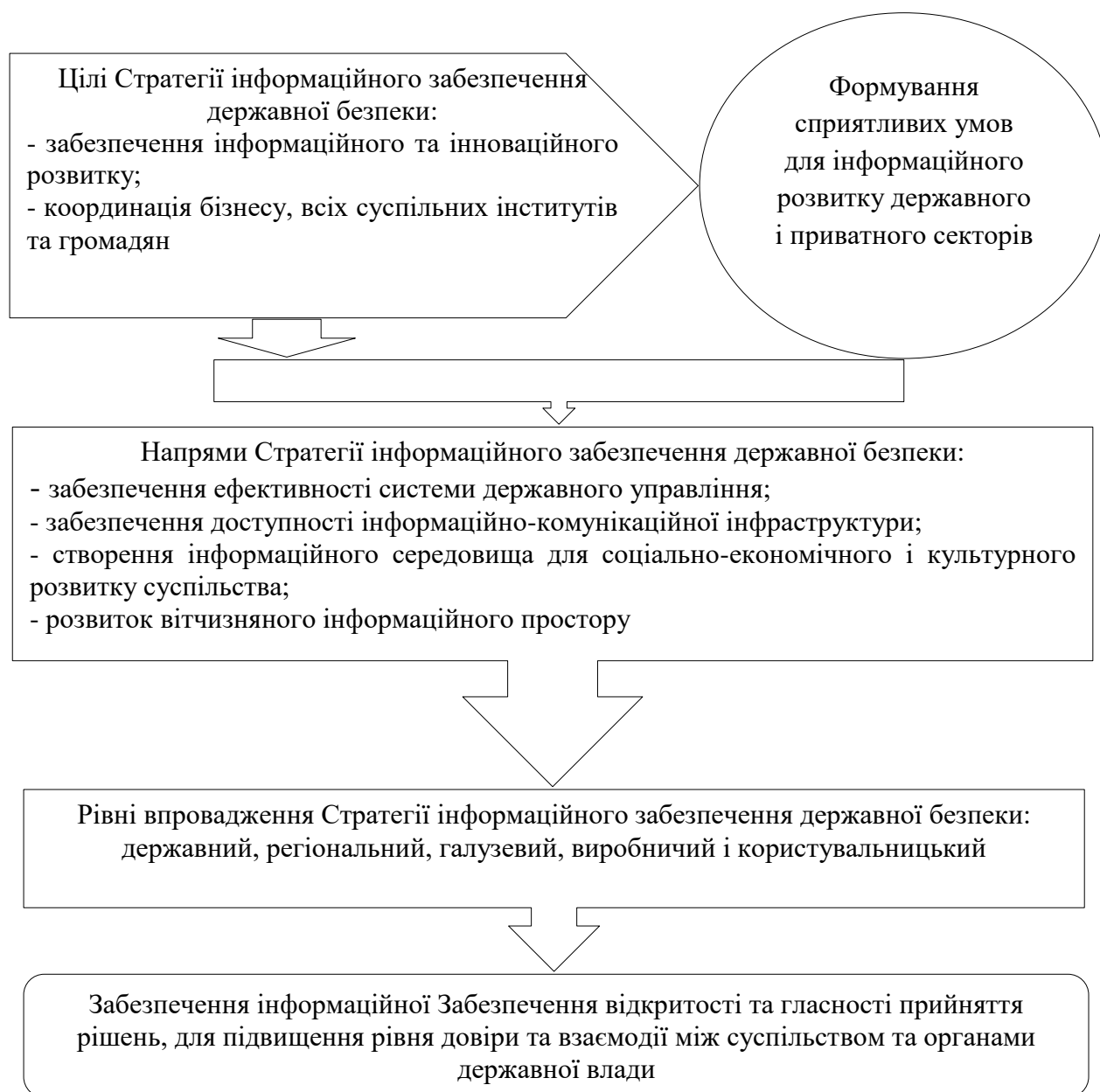
Рис. 3. Узагальнена модель формування Стратегії інформаційного забезпечення державної безпеки