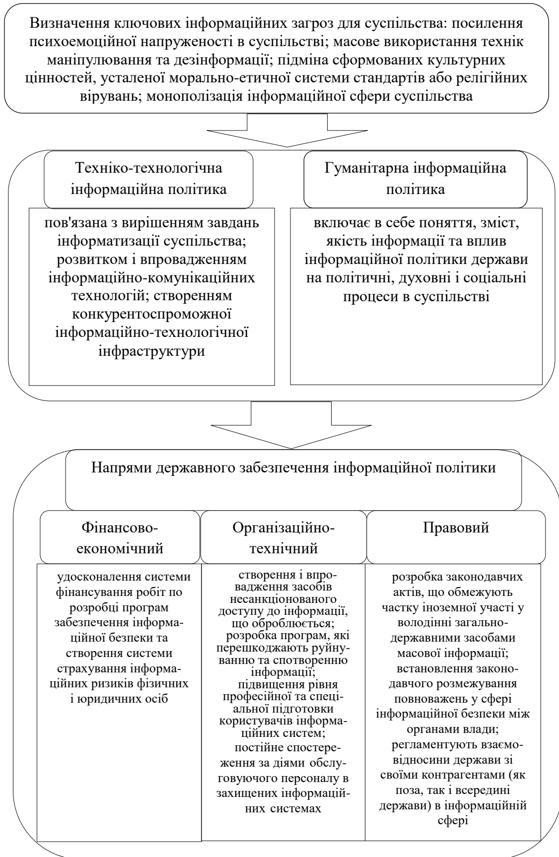
Рис. 1. Модель вдосконалення державної інформаційної політики