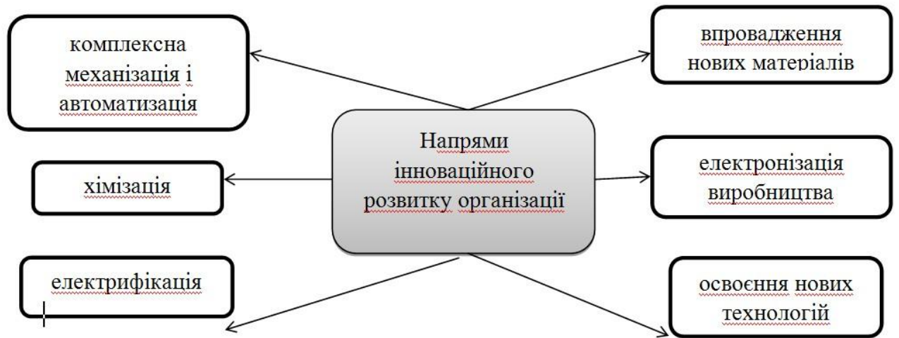
Рис. 2 Напрями інноваційного розвитку організації

Скорочення кількості інноваційних підприємств є наслідком ряду проблем, що накопичилися в українській економіці та в сфері НДКР зокрема: