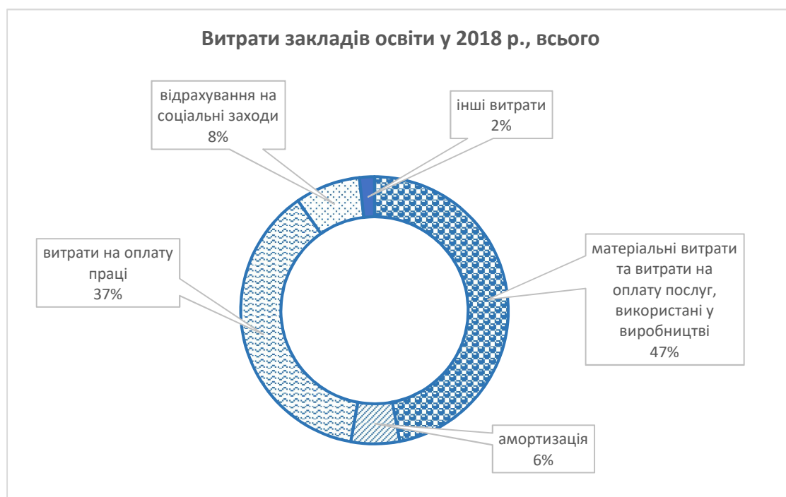
Рис. 3. – Структура виробничих витрат закладів освіти України в 2018 р., %