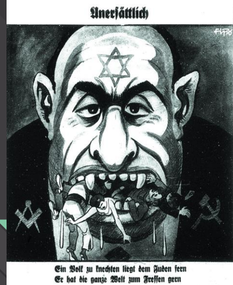
Карикатура на євреїв часів Третього Рейху

спотвореного стереотипу про лукавому єврейському капіталіста, який отримував все більш широке поширення в Європі