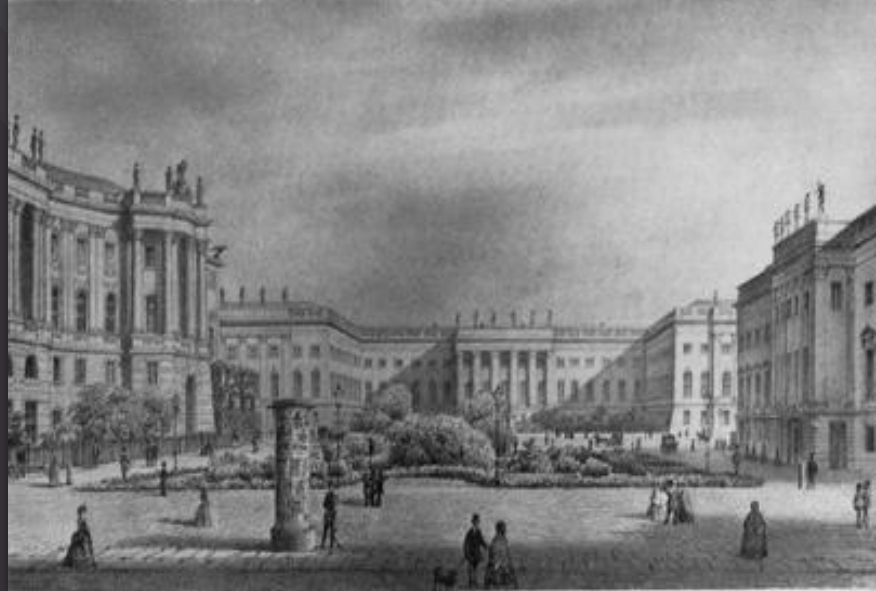
Берлінський Університет на початку XX ст.

Такий різкий поворот, можливо, пояснювався тим, що Зомбарт довго був на задвірках Берлінського Університету і відчував, що для отримання високого наукового звання необхідно було бути політично затребуваним (в кінцевому рахунку, в Берліні в 1917 році, слідуючи Вагнеру і Шмоллеру)